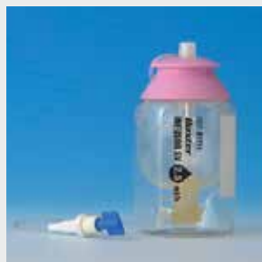
■ 内視鏡・関節鏡用接続チューブ